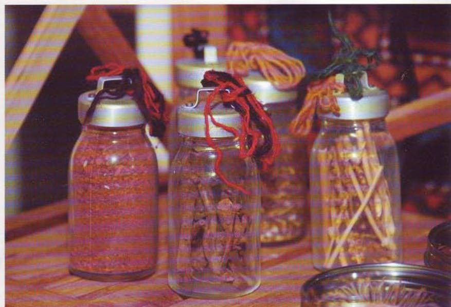
I showroomet i Haldrup kan man se planterne, som giver tæpperne farve.

Man kan bestille tæpper i en bestemt størrelse eller mønster, men der er naturligvis en vis leveringstid på sådan et produkt. Dog mener